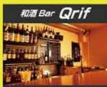
和酒 Bar Qrif