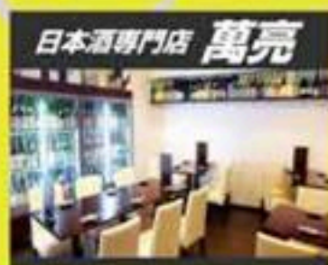
日本酒専門店 萬亮

飲食激戦区港区「浜松町・大門」エリアで日本酒自慢の各店が主催する飲み歩き大宴会イベント第8回。 今回のテーマは「お気に入りの地域を応援！」各店1県のお酒とお料理をご提供します！