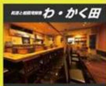
和酒自慢の店 わ・かく田