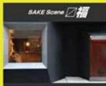
SAKE Scene 福